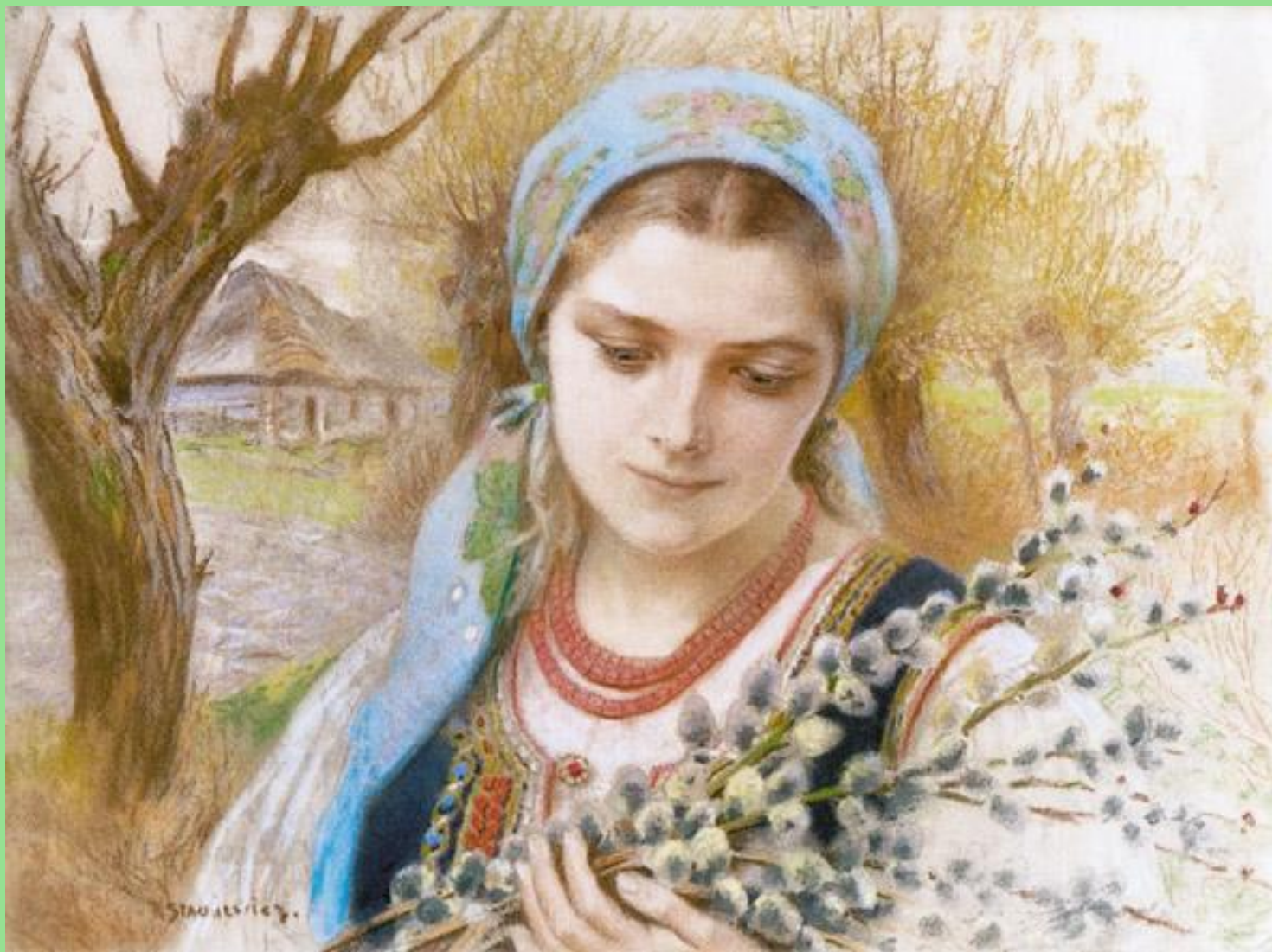
Piotr Stachewicz (1858–1938), Wiosna – portret wiejskiej dziewczyny , Własność prywatna (?).