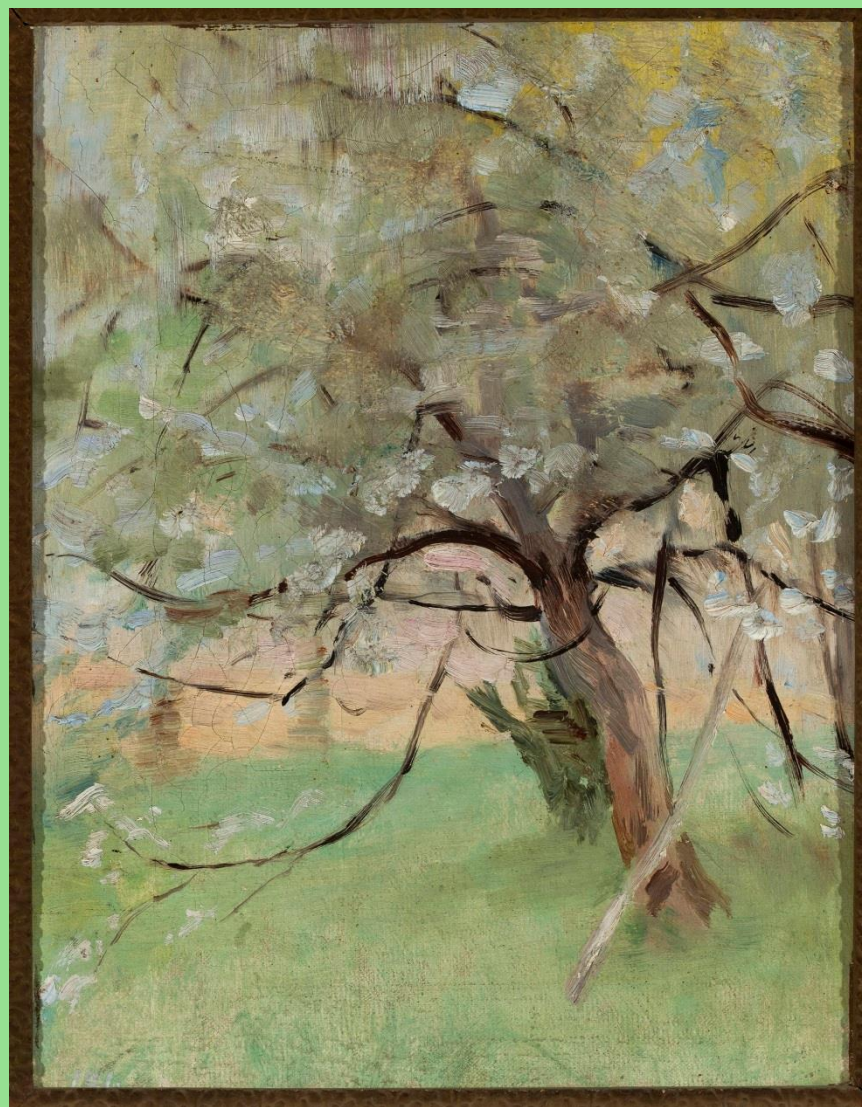
Jan Ciagliński (1858–1913), Jabłoń , ok. 1900 r. W zbiorach Muzeum Narodowego w Warszawie.