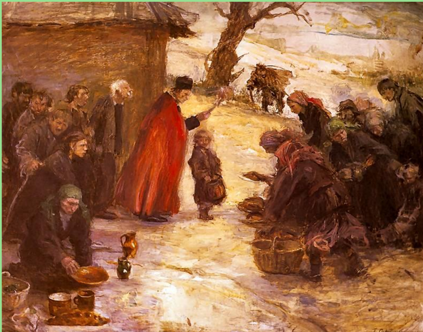
Teodor Axentowicz (1859–1938), Święcone , ok. 1899 r. W zbiorach Muzeum Sztuki w Łodzi.