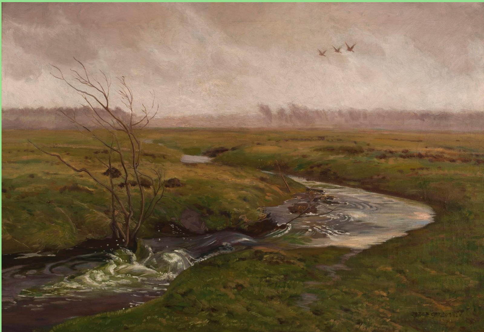
Józef Chełmoński (1849–1914), Wiosna , 1892 lub 1902 r. W zbiorach Muzeum Narodowego w Warszawie.