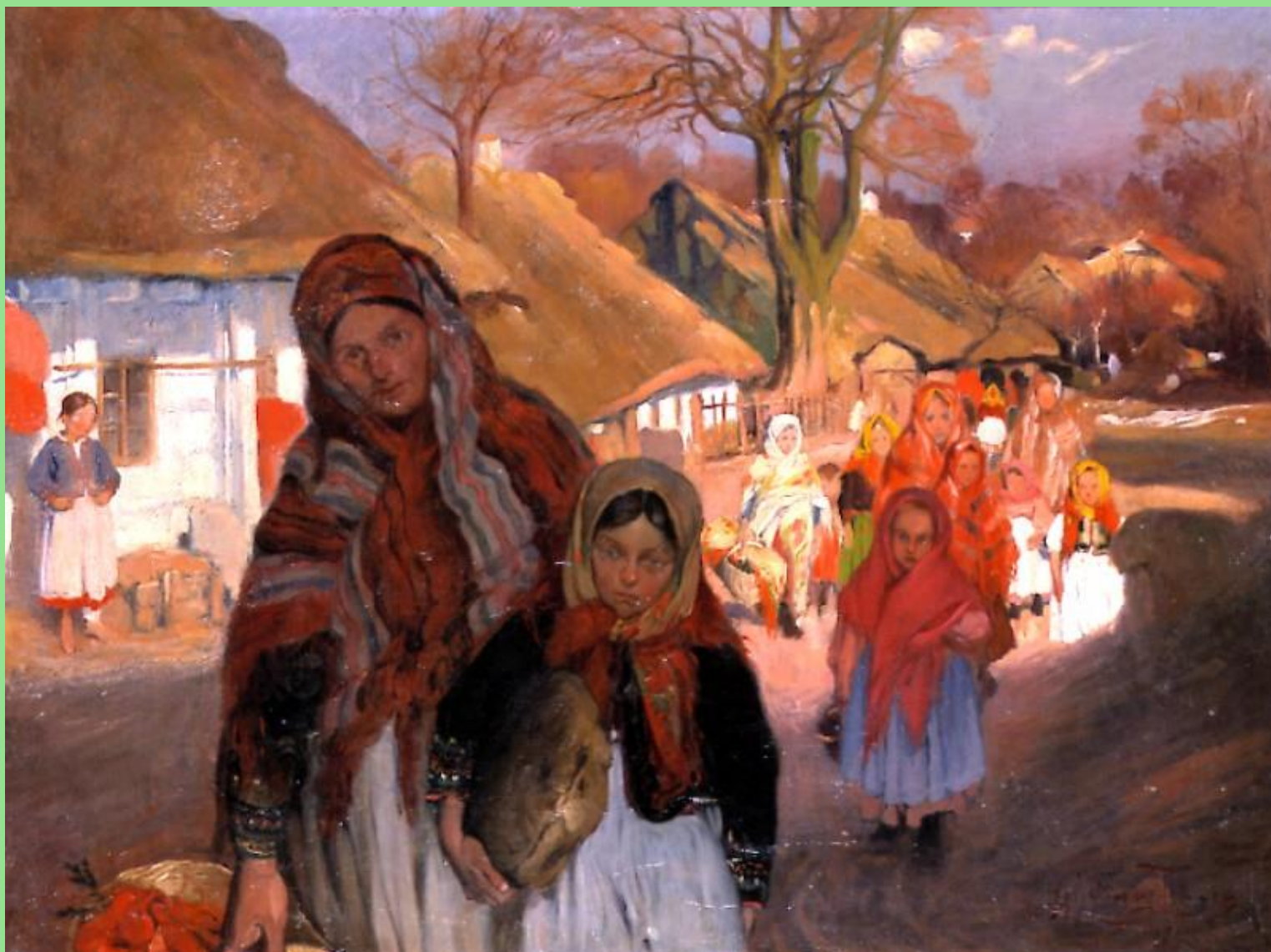
Włodzimierz Tetmajer (1862–1923), Wielkanoc w Bronowicach , 1904 r. Własność prywatna (?).