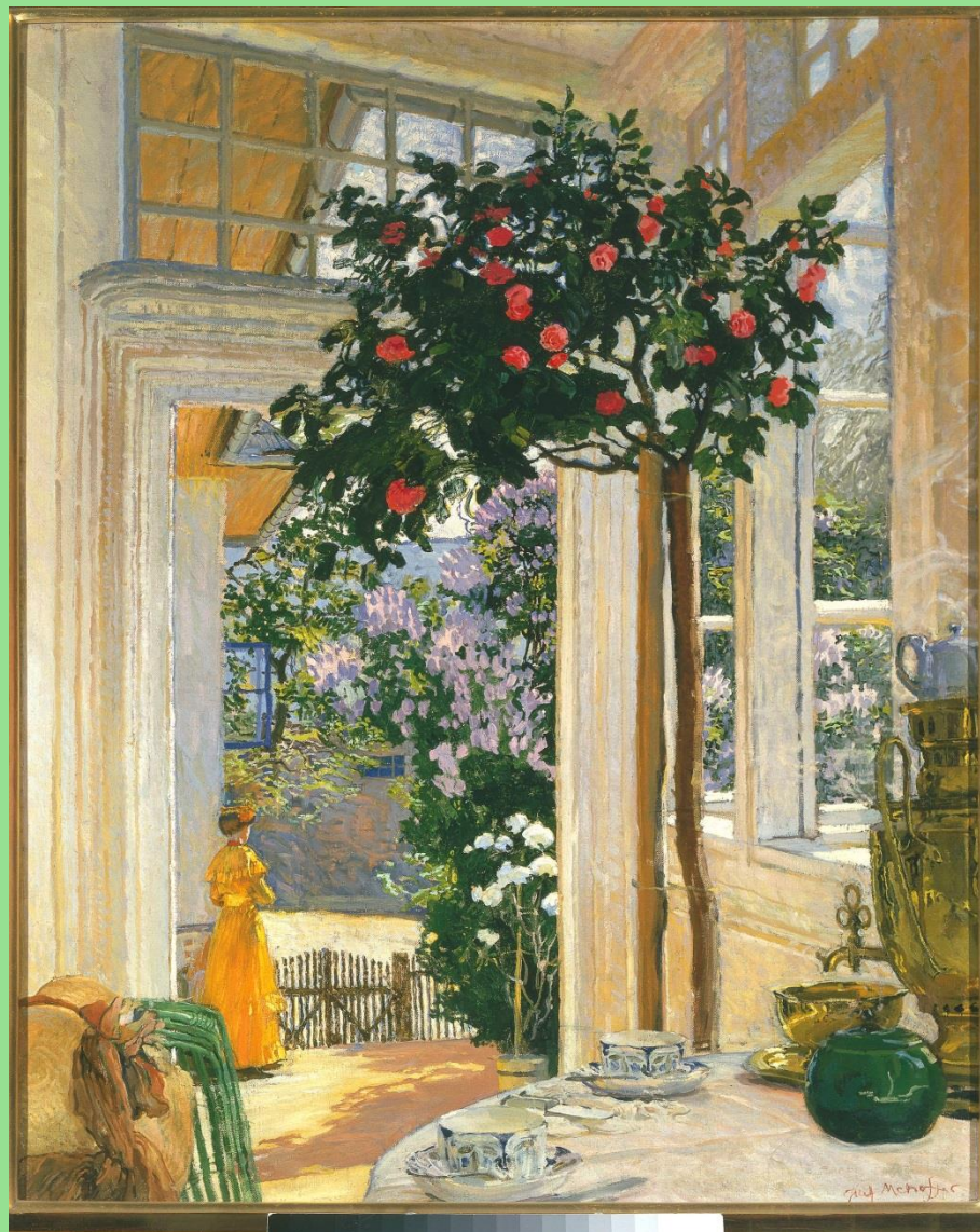
Józef Mehoffer (1869–1946), Słońce majowe , 1911 r. W zbiorach Muzeum Narodowego w Warszawie.