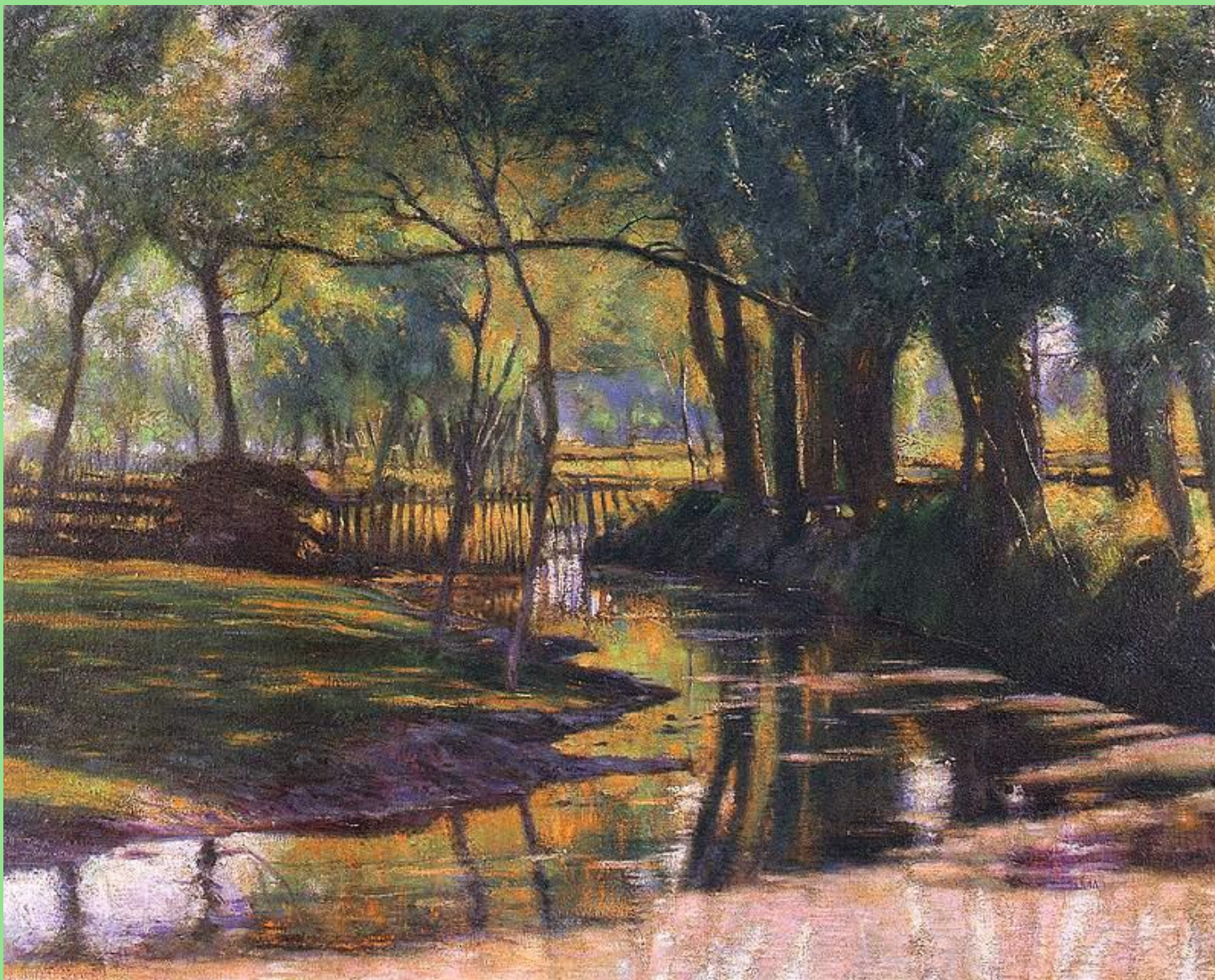
Władysław Podkowiński (1866–1895), Strumień między drzewami , 1893 r. W zbiorach Muzeum Narodowego w Warszawie.