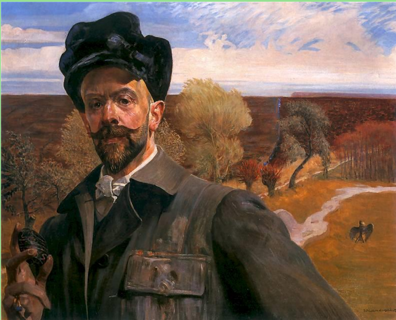
Jacek Malczewski (1854–1929), Autoportret z pisanką , 1909 r. W zbiorach Muzeum Narodowego w Poznaniu.