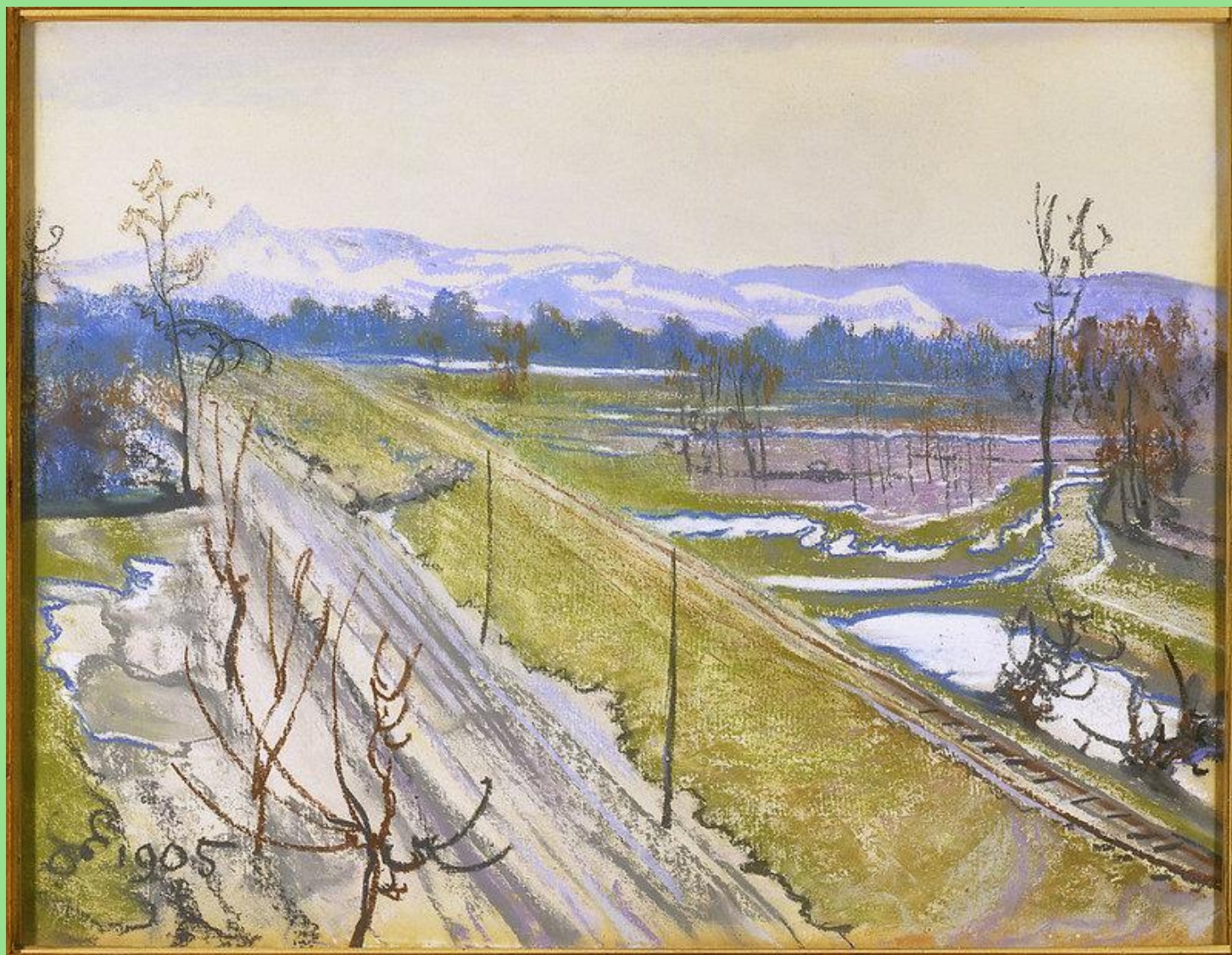
Stanisław Wyspiański (1869–1907), Widok z okna pracowni artysty na Kopiec Kościuszki, 1905 r. W zbiorach Muzeum Narodowego w Warszawie.