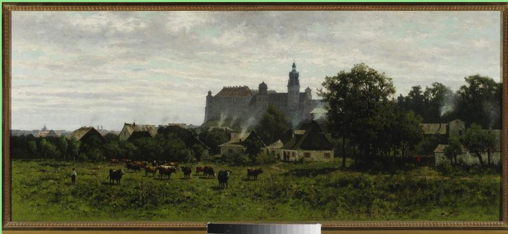
Władysław Aleksander Malecki (1836–1900), Widok na Wawel , 1873 r. W zbiorach Muzeum Narodowego w Warszawie.