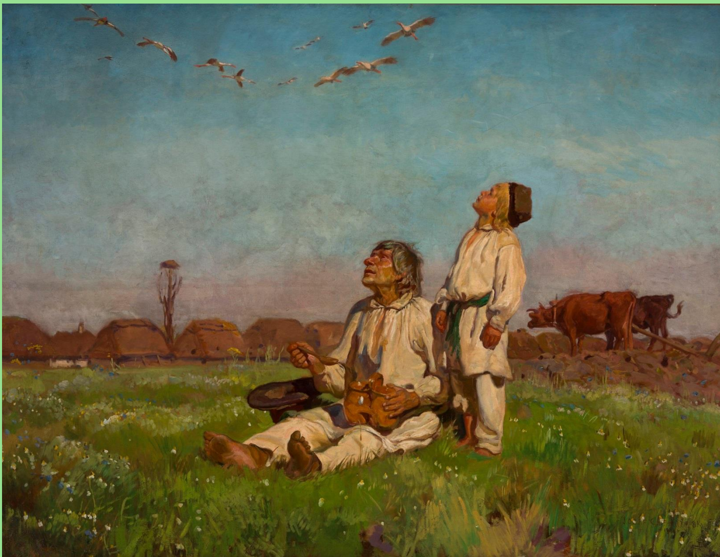
Józef Chełmoński (1849–1914), Bociany , 1900 r. W zbiorach Muzeum Narodowego w Warszawie.