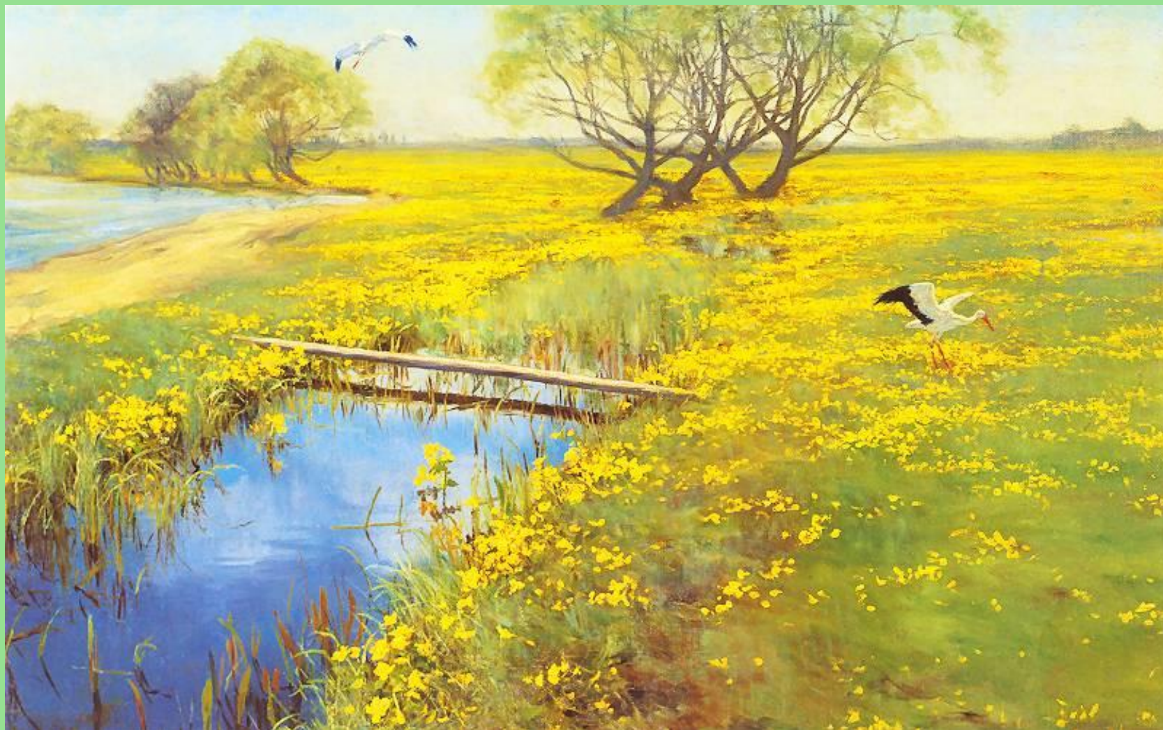
Henryk Weyssenhoff (1859–1922), Wiosna , 1910/11 r. W zbiorach Muzeum Narodowego w Warszawie.