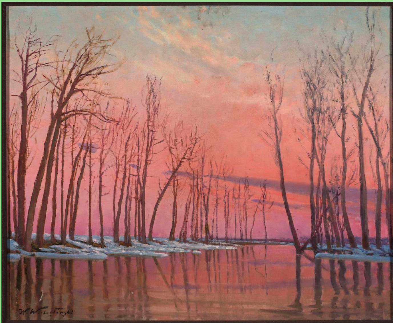
Wacław Wielogłowski (1860–1933), Zaranie wiosny , 1900 r. W zbiorach Muzeum Narodowego w Warszawie.