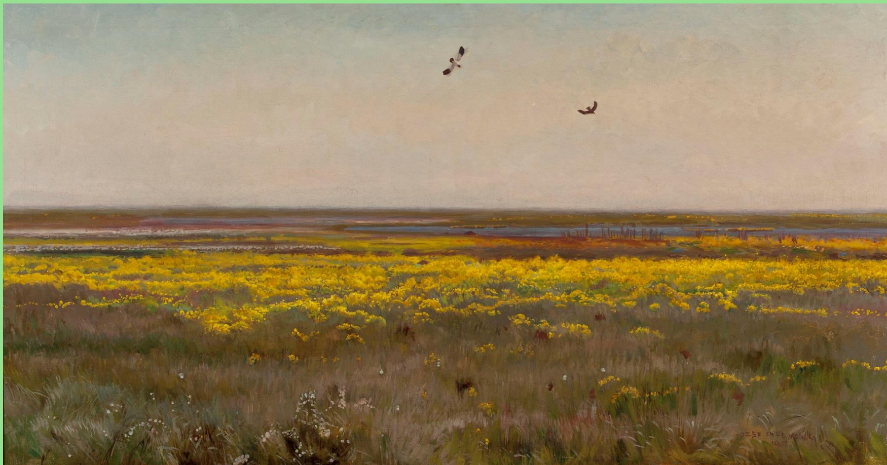
Józef Chełmoński (1849–1914), Kaczeńce , 1908 r. W zbiorach Muzeum Narodowego w Warszawie.