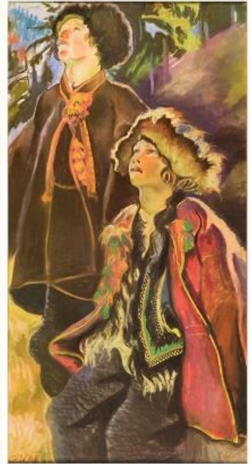
Kazimierz Sichulski (1879–1942), Niedziela palmowa (tryptyk) , 1906 r. W zbiorach Muzeum Narodowego w Krakowie.