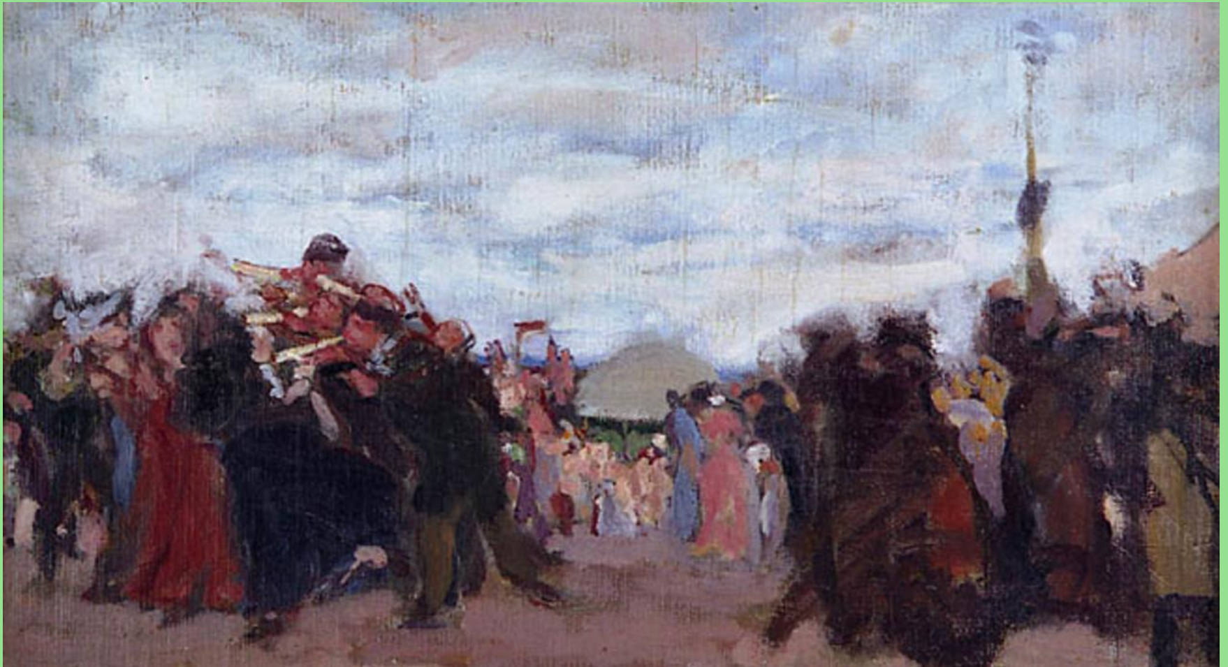
Wojciech Weiss (1875–1950), Rękawka , 1899 r. Własność prywatna (?).