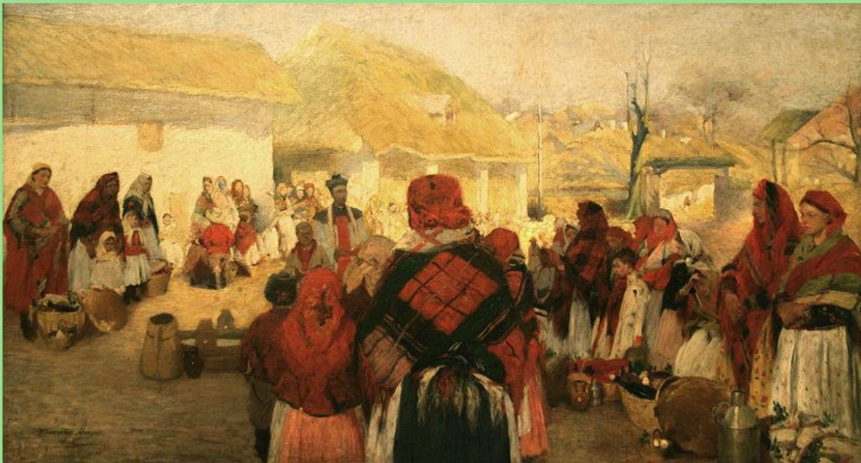
Włodzimierz Tetmajer (1862–1923), Święcone (Święcone w Bronowicach) , 1897 r. W zbiorach Muzeum Narodowego w Krakowie.