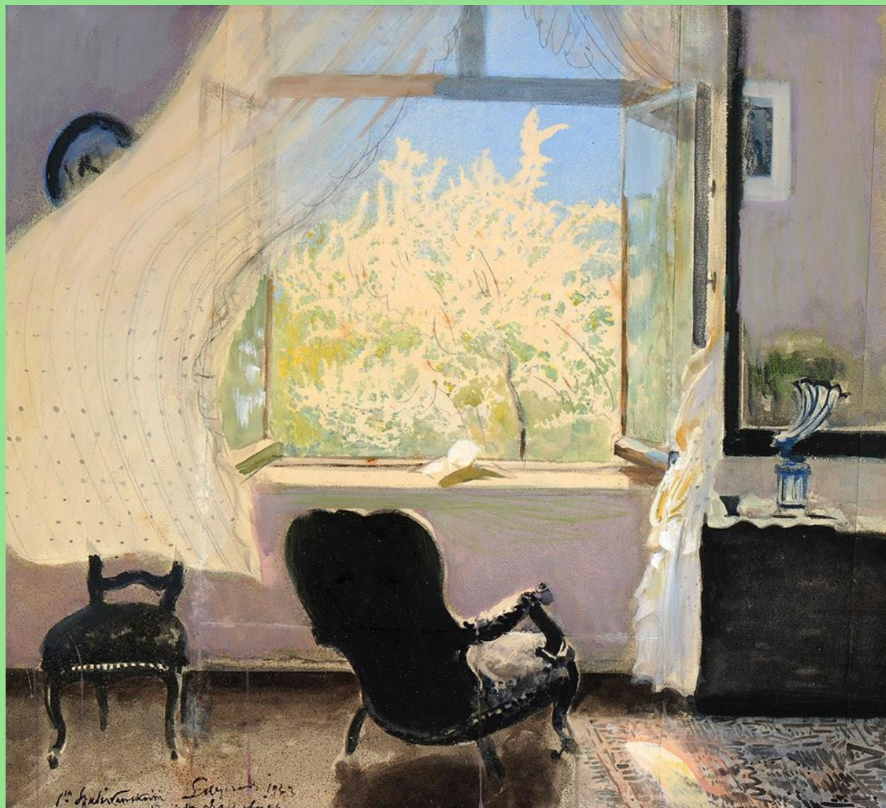
Leon Wyczółkowski (1852–1936), Wiosna – wnętrze pracowni artysty , 1931 r. lub 1933r.

W zbiorach Muzeum Okręgowego w Bydgoszczy.