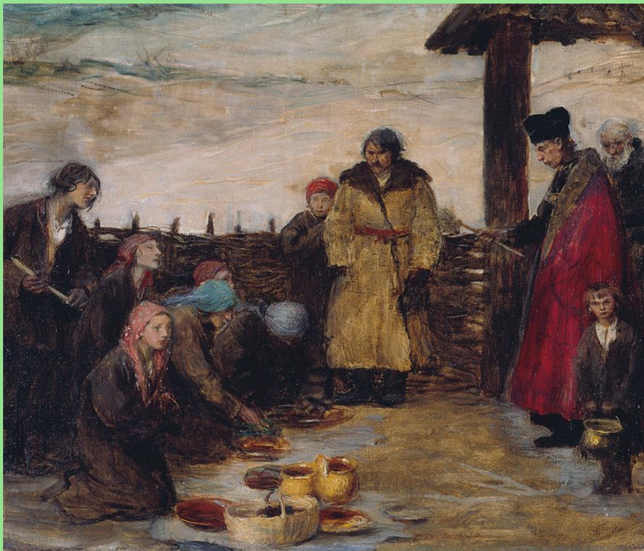
Teodor Axentowicz (1859–1938), Święcone , Własność prywatna (?).